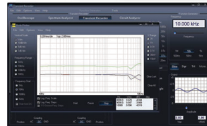
Enregistreur de signaux transitoires