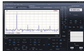
Analyseur de spectres