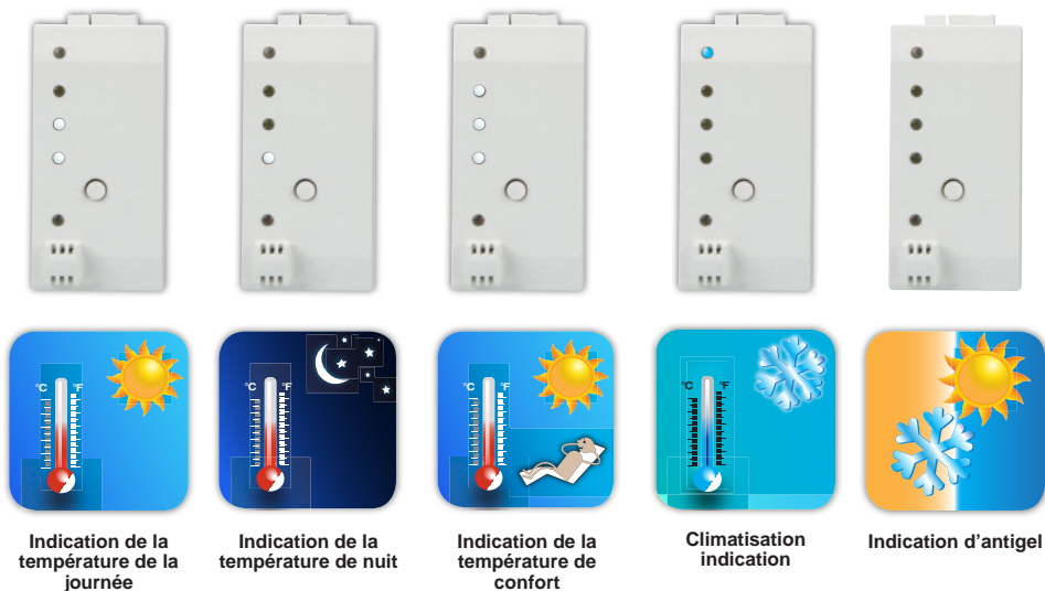
Indication de la température de la journée